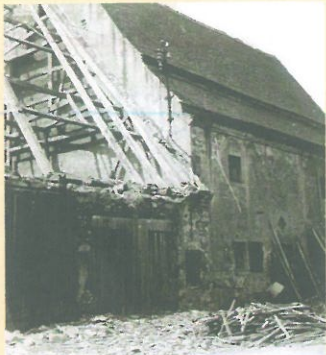
Beginnender Abriss der großen Scheune, neben der Malztenne Anfang der 70-er Jahre