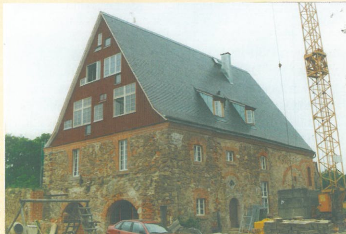
Neubau auf den Ruinen der Malztenne als Wohnhaus der Familie v. Below durch den Architekten Ulrich Bode, 1999