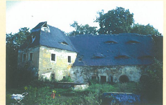
Brauereigebäude um 1990