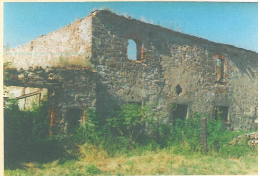
Malztenne um 1990