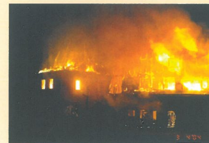
nochmalige Zerstörung durch Brandstiftung am 3. April 2004