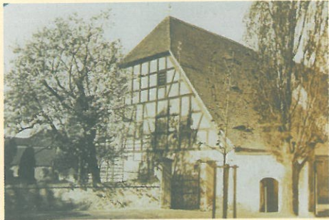
Die große Scheune am Schlosstor mit der neugepflanzten Kastanie um 1925