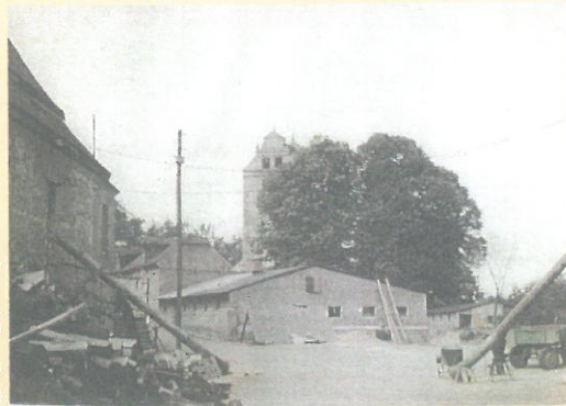
Wirtschaftshof mit einem neugebauten Schweinestall der LPG "Freie Erde Döben" über den zugeschütteten Burggräben Anfang der 70-er Jahre