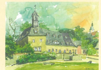
nach dem 2. Wiederaufbau 2007 Aquarell Steffen Gröbner