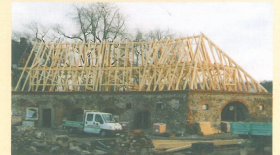
Wiederaufbau Brauereigebäude 1999/2000