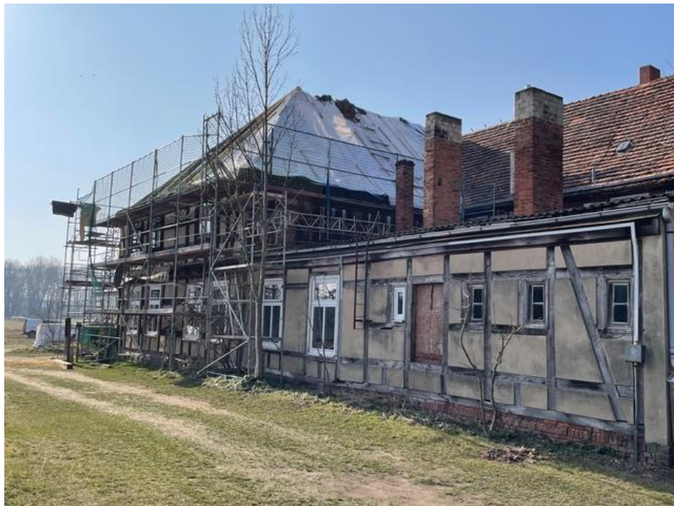
Plänitz Bauzustand März 2025

Raiffeisenbank Ostprignitz-Ruppin IBAN: DE 68 1606 1938 0103 0127 94