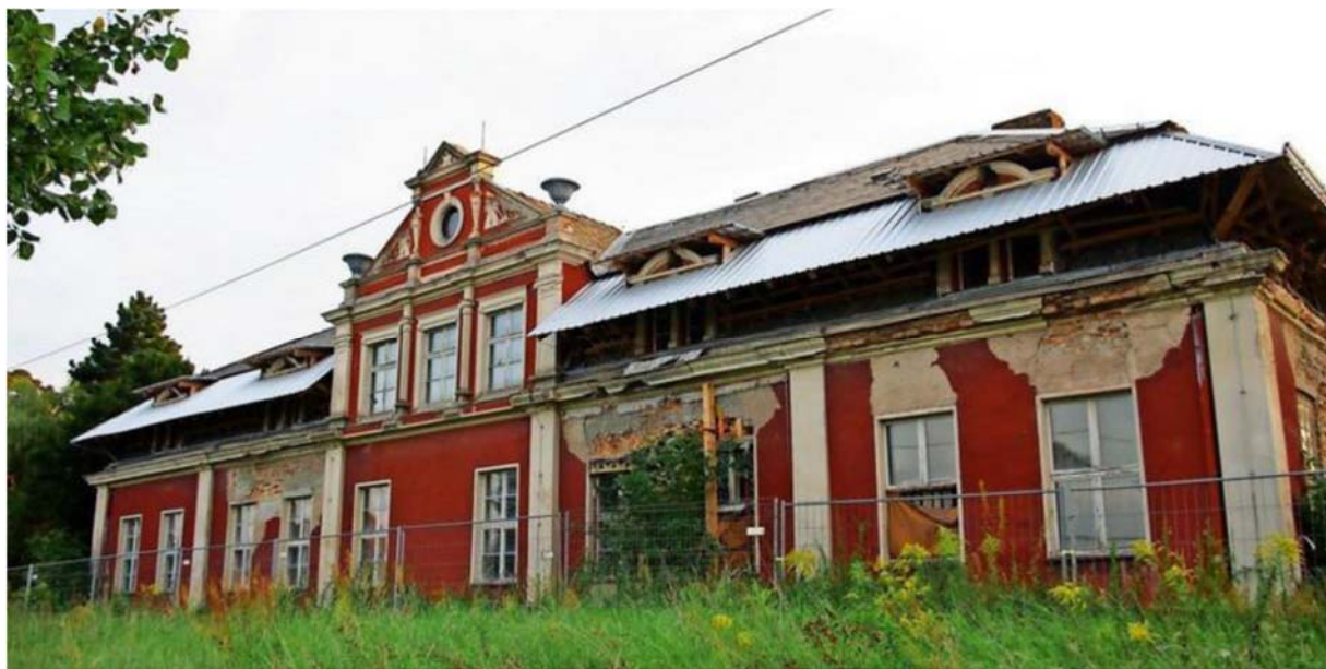
Das Gutshaus Satzkorn

P.S. Als Anhang – Zeitungsartikel (Potsdamer Zeitung) über Satzkorn.